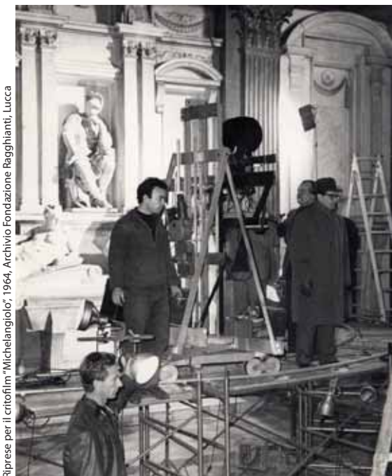
Riprese per il critofilm "Michelangiolo", 1964

Università degli Studi di Firenze Biblioteca di Scienze Tecnologiche Dipartimento di Architettura