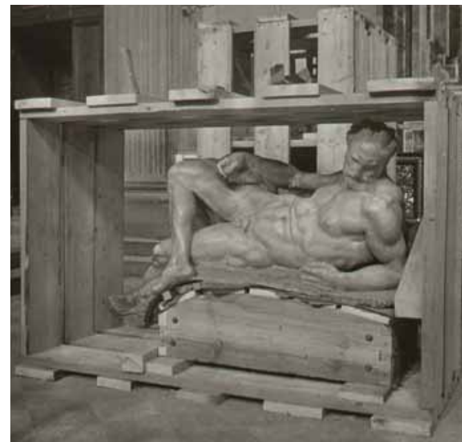
Il Crepuscolo, Sagrestia Nuova. Operazioni per il ricovero delle sculture, 1943.